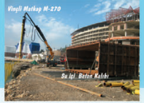
Vinçli Matkap M-270