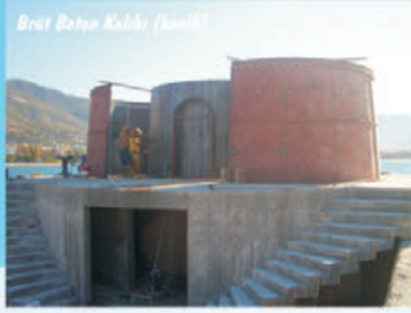
Brüt Beton Kalıbı (İmalat)