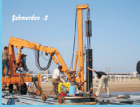
Şahmerdan - 2