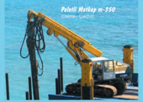
Paletli Matkap m-350 (Dalme - Çakma)