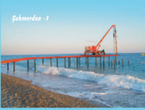
Şahmerdan - 1